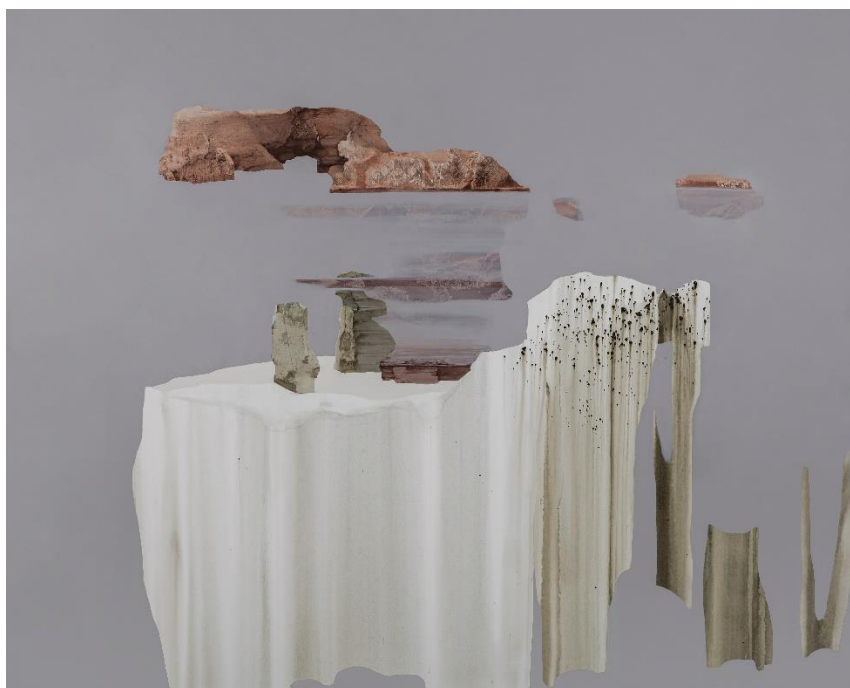
La table éphémère , 2022, acrylique sur toile, 130 x 162 cm

L'exposition a lieu dans le cadre d'une collaboration entre le Centre Culturel Coréen , le MNAAG - Musée National des arts asiatiques - Guimet et la Galerie Maria Lund , initiée à l'occasion de la Carte blanche offerte à Min Jung-Yeon au MNAAG en 2019-2020.