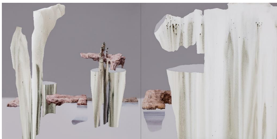
Silence 2 - diptyque, 2022, acrylique sur toile, 150 x 300 cm

Le vécu de l'artiste s'imisce dans l'universalité. La lutte est un sujet récurrent - celle entre éléments de nature opposée et celle de nos émotions. Avec Désert plein – soif, sommeil, silence Min Jung-Yeon convoque un espace de perception ouvert où désir et soif sont besoin et moteur, le sommeil, absence et présence et le silence un état des plus intenses. Le désert est plein !