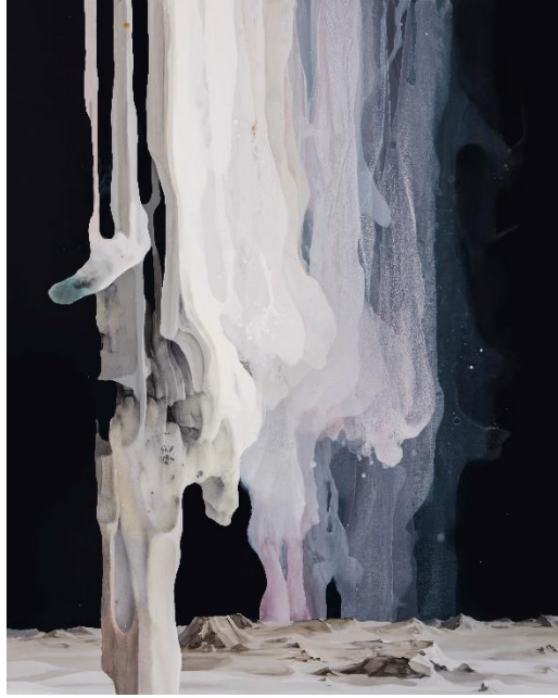
Pluie douce , 2022, acrylique sur toile, 162 x 130 cm