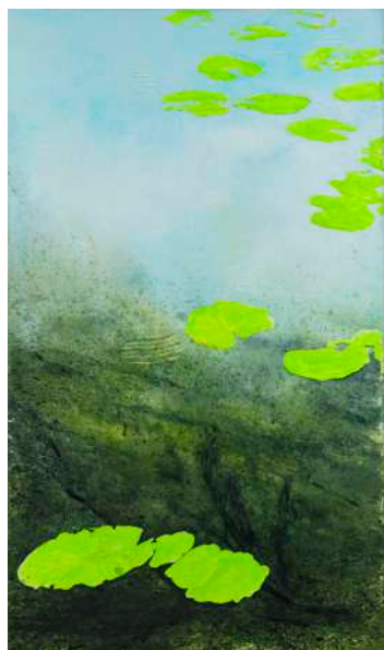
DIDIER BOUSSARIE Etang communal (triptyque) | 2024 acrylique sur toile / acrylic on canvas dimension variables / various dimensions (l'ensemble / 195 x 341 cm N° Inv. DB.2024.027