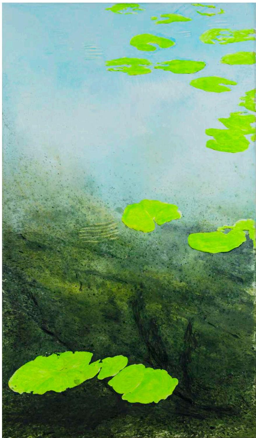
DIDIER BOUSSARIE Etang communal C (triptyque) | 2024 acrylique sur toile / acrylic on canvas 195 x 114 cm N° Inv. DB.2024.027