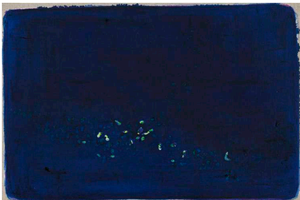
DIDIER BOUSSARIE L'allée des lucioles I | 2026 acrylique sur toile / acrylic on canvas 24 x 41 cm / 9.45 x 16.14 in N° Inv. DB.2026.007