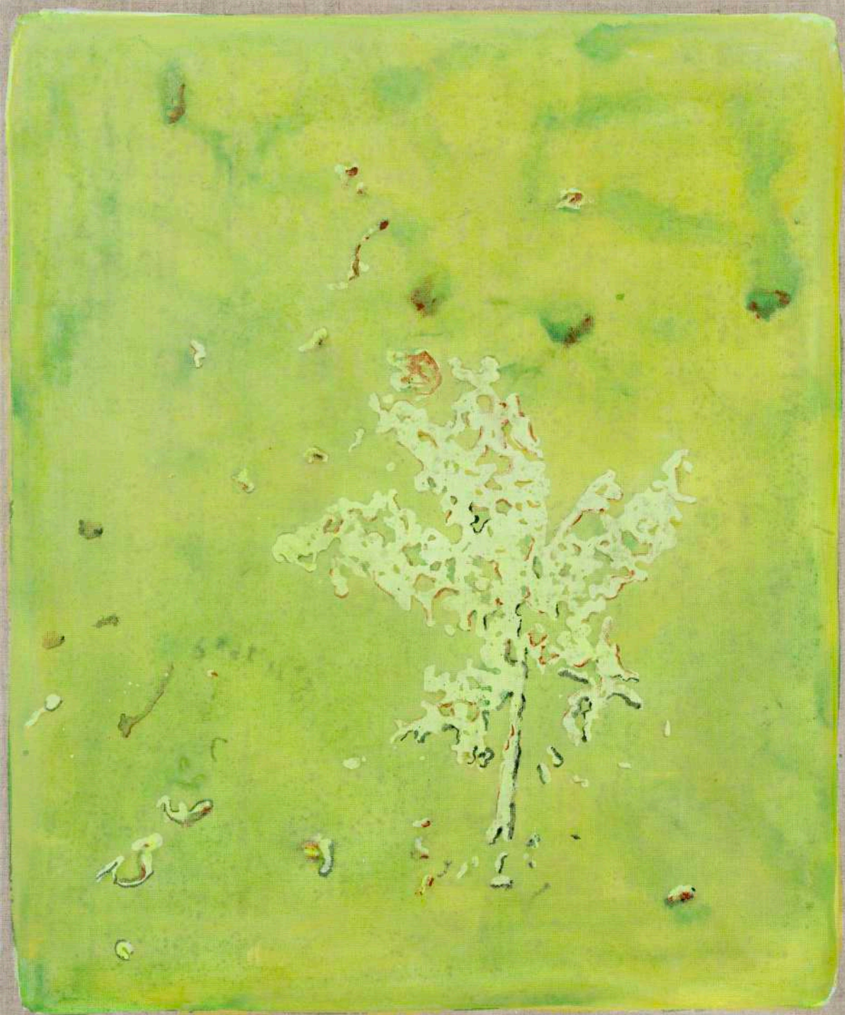
DIDIER BOUSSARIE Cosmogonie terrestre, planète feuille II | 2026 acrylique sur toile / acrylic on canvas 55 x 46 cm / 21.65 x 18.11 in N° Inv. DB.2026.006