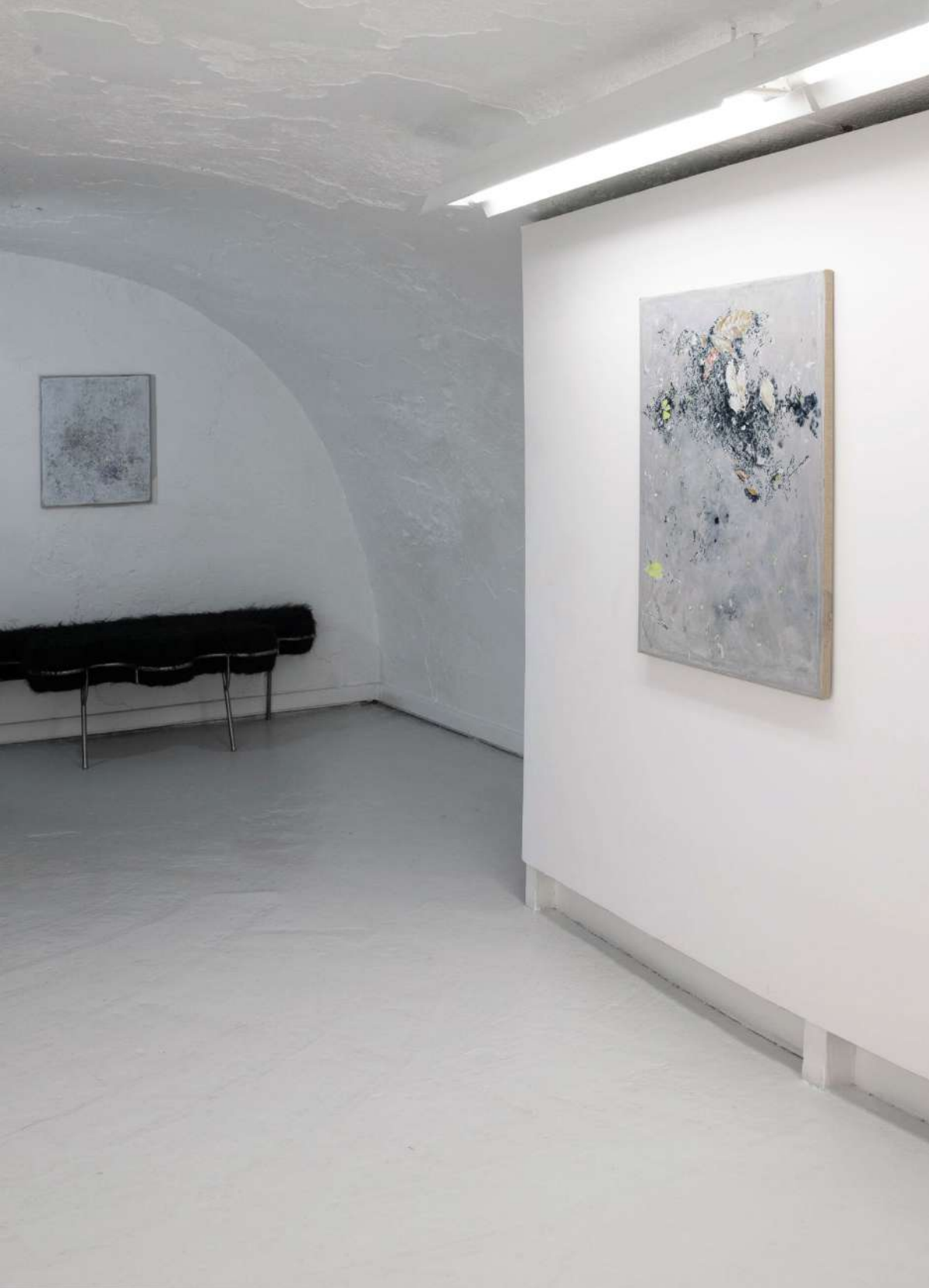
Didier Boussarie, Ce que la lumière touche – Galerie Maria Lund, Paris | 2026

Vue d'exposition / exhibition view