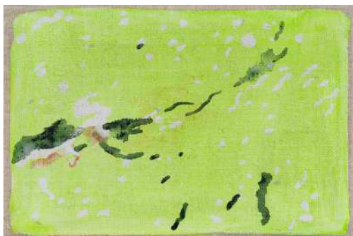
DIDIER BOUSSARIE Cosmogonie terrestre V – a. + b. (diptyque) | 2026 acrylique sur toile / acrylic on canvas chacun / each 12 x 18 cm / 4.72 x 7.09 in N° Inv. DB.2026.004