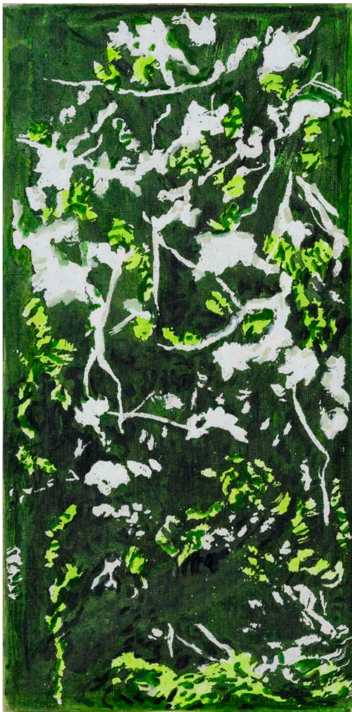
DIDIER BOUSSARIE Floraison de printemps III - C (trptyque) | 2025 acrylique sur toile / acrylic on canvas 60 x 30 cm / 23.62 x 11.81 in N° Inv. DB.2025.010