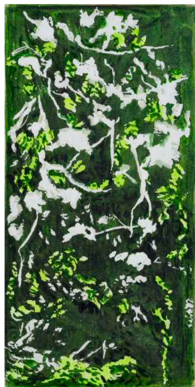
DIDIER BOUSSARIE Floraison de printemps III (triptyque) | 2025 acrylique sur toile / acrylic on canvas 60 x 30 cm / 23.62 x 11.81 in N° Inv. DB.2025.010