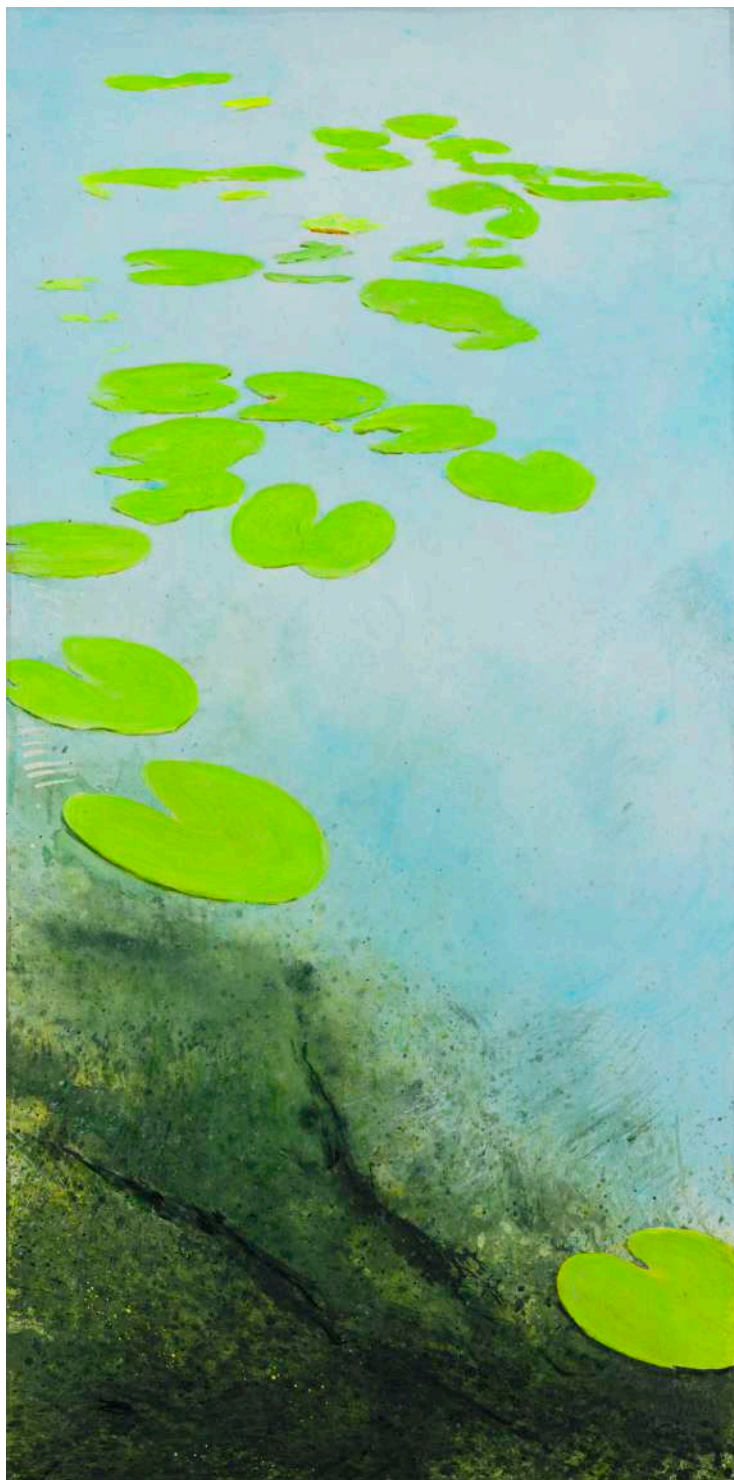
DIDIER BOUSSARIE Etang communal A (triptyque) | 2024 acrylique sur toile / acrylic on canvas 195 x 97 cm N° Inv. N° Inv. DB.2024.027