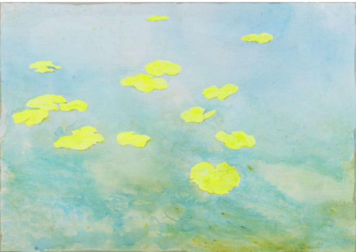
DIDIER BOUSSARIE Nymphoides peltata | 2024 acrylique sur toile / acrylic on canvas 114 x 162 cm / 44.88 x 63.78 in N° Inv. MW.2024.020