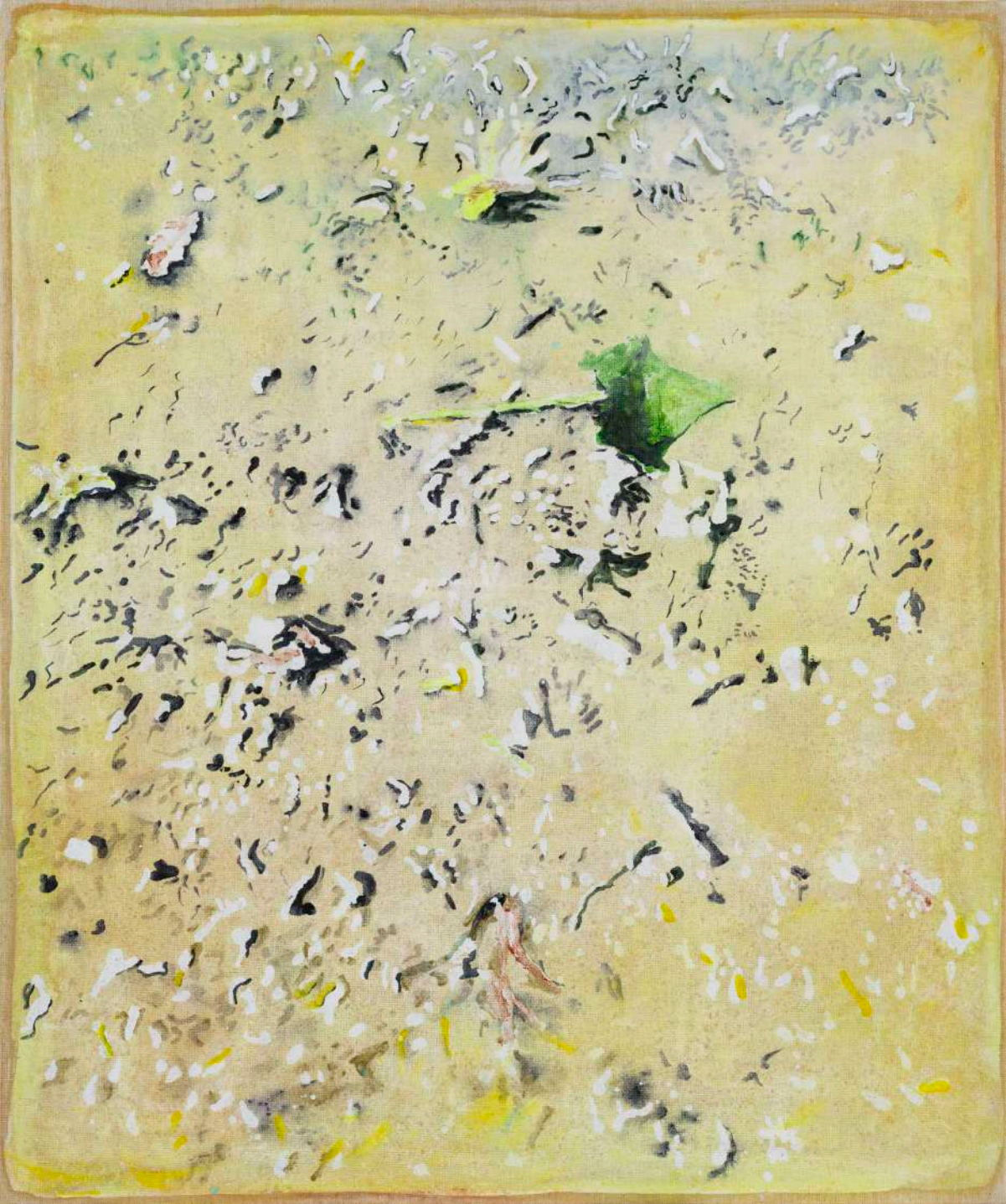
DIDIER BOUSSARIE Cosmogonie terrestre I | 2025 acrylique sur toile / acrylic on canvas 55 x 46 cm / 21.65 x 18.11 in N° Inv. DB.2025.017