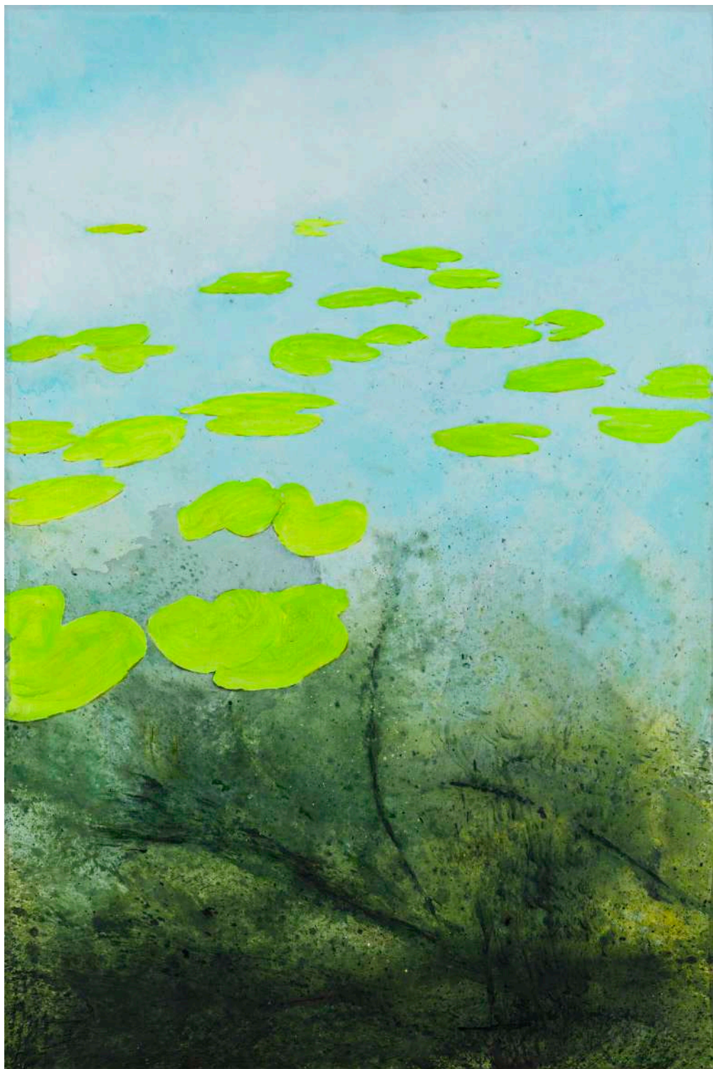
DIDIER BOUSSARIE Etang communal B (triptyque) | 2024 acrylique sur toile / acrylic on canvas 195 x 130 cm N° Inv. DB.2024.027