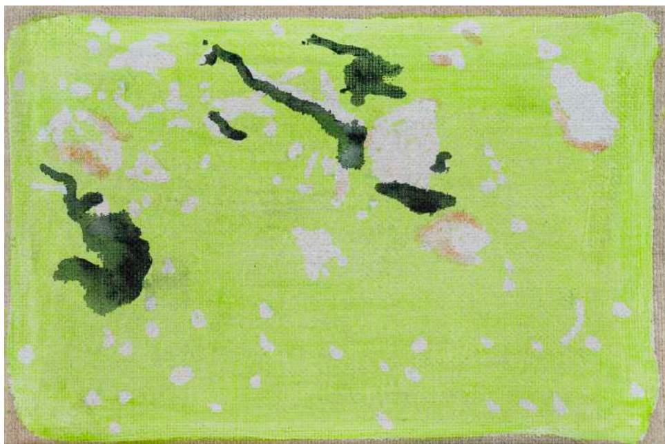
DIDIER BOUSSARIE Cosmogonie terrestre V - a. (diptyque - dyptich) | 2026 acrylique sur toile / acrylic on canvas chacun / each 12 x 18 cm / 4.72 x 7.09 in N° Inv. DB.2026.004 photo : François Lauginie