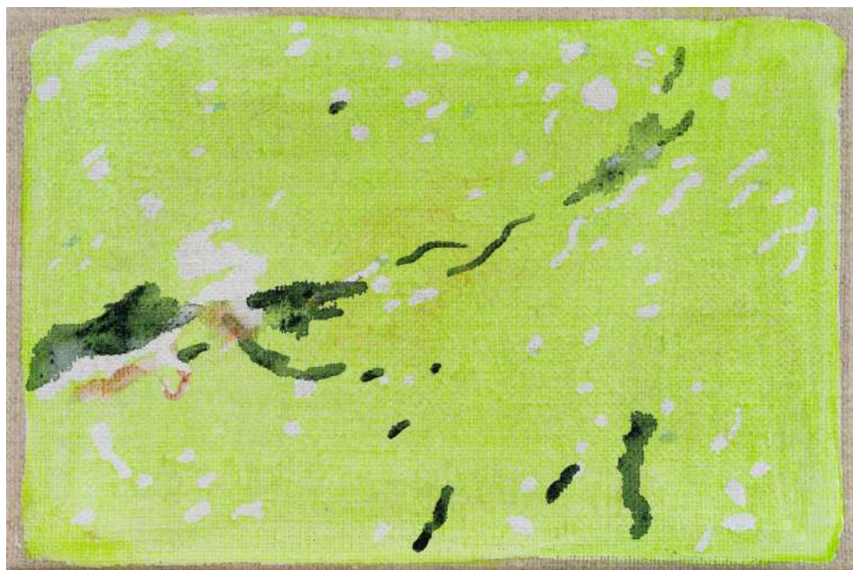
DIDIER BOUSSARIE Cosmogonie terrestre V - b. (diptyque - dyptich) | 2026 acrylique sur toile / acrylic on canvas chacun / each 12 x 18 cm / 4.72 x 7.09 in N° Inv. DB.2026.004