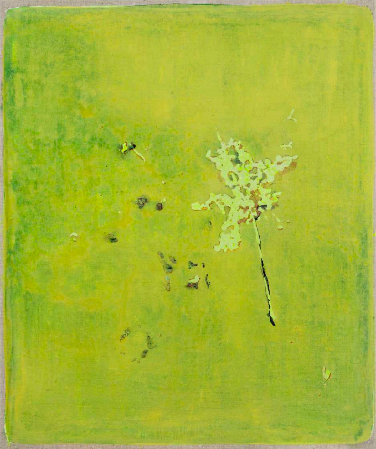
DIDIER BOUSSARIE Cosmogonie terrestre, planète feuille I | 2026 acrylique sur toile / acrylic on canvas 55 x 46 cm / 21.65 x 18.11 in N° Inv. DB.2026.005