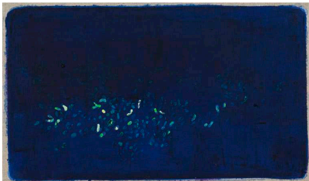
DIDIER BOUSSARIE L'allée des lucioles II | 2026 acrylique sur toile / acrylic on canvas 27 x 41 cm / 10.63 x 16.14 in N° Inv. DB.2026.008