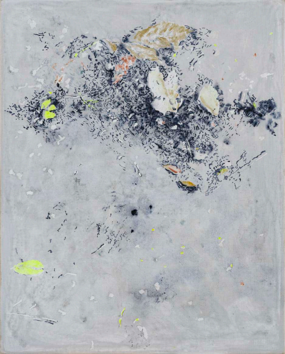
DIDIER BOUSSARIE Cosmogonie terrestre IV | 2025 acrylique sur toile / acrylic on canvas 81 x 65 cm / 31.89 x 25.59 in N° Inv. DB.2025.020