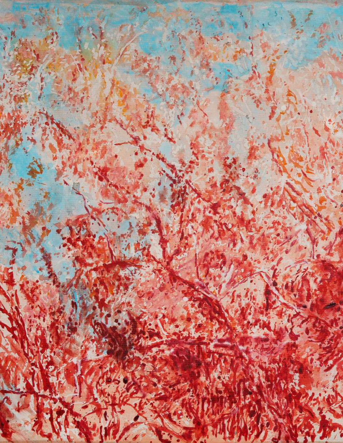
DIDIER BOUSSARIE Buisson rouge (détail) | 2024 acrylique sur toile / acrylic on canvas 81 x 116 cm / 31.89 x 45.67 in N° Inv. MW.2024.026