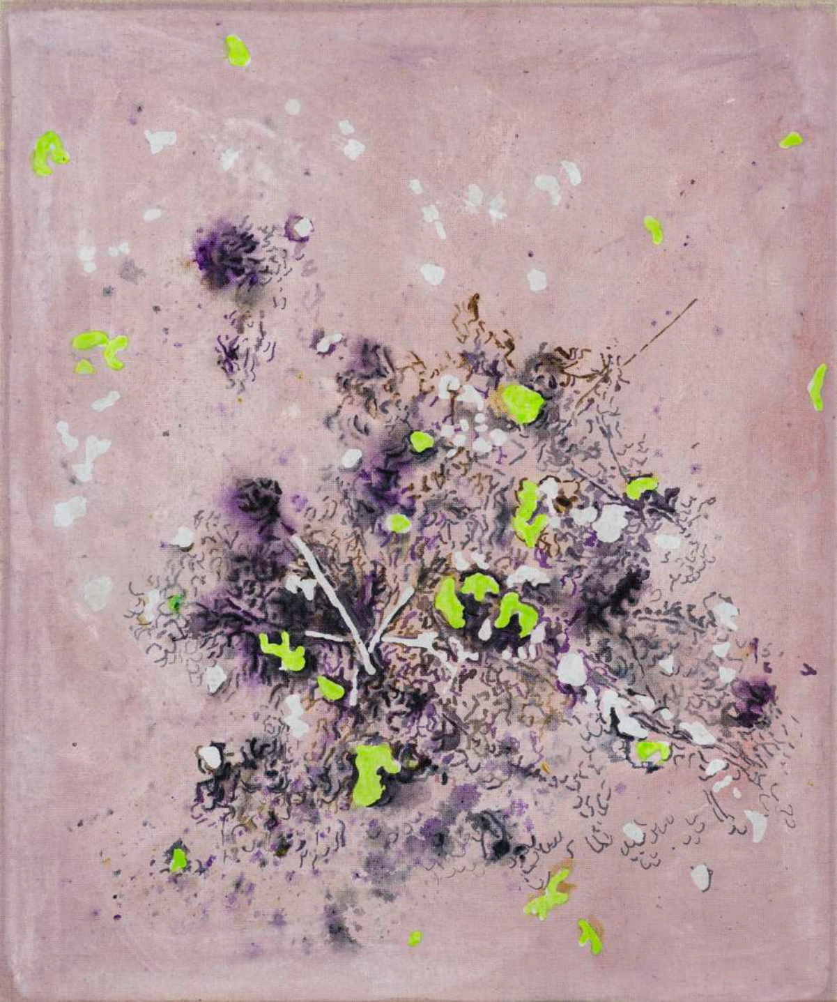
DIDIER BOUSSARIE Cosmogonie terrestre III | 2025 acrylique sur toile / acrylic on canvas 55 x 46 cm / 21.65 x 18.11 in N° Inv. DB.2025.019