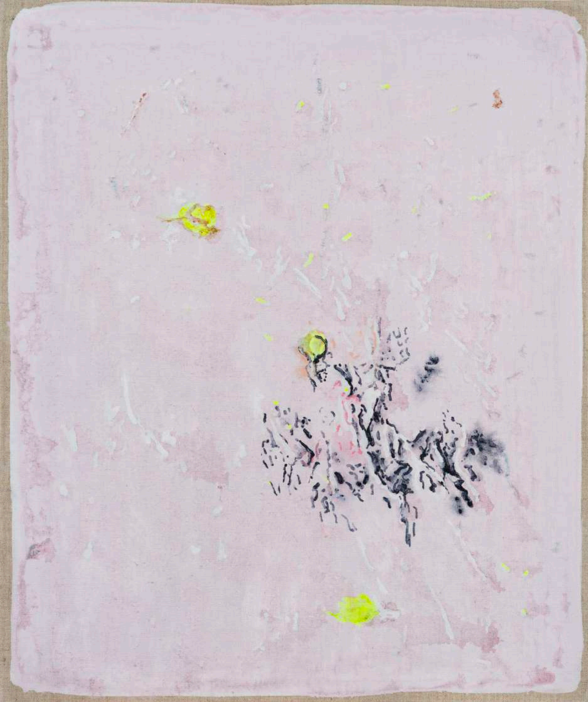
DIDIER BOUSSARIE Cosmogonie terrestre II | 2025 acrylique sur toile / acrylic on canvas 55 x 46 cm / 21.65 x 18.11 in N° Inv. DB.2025.018