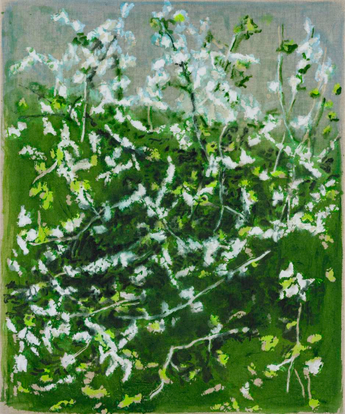
DIDIER BOUSSARIE Floraison de printemps II | 2025 acrylique sur toile / acrylic on canvas 65 X 54 cm / 25.59 x 21.26 in N° Inv. DB.2025.009