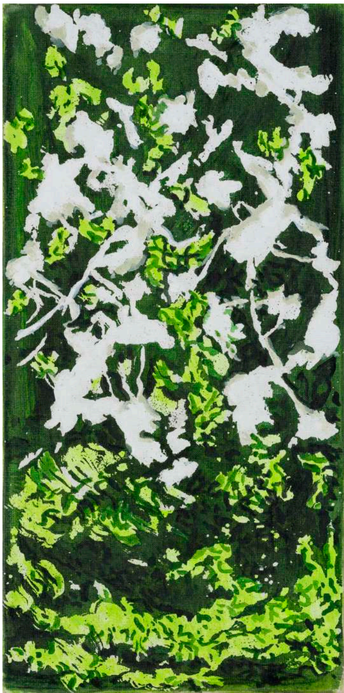
DIDIER BOUSSARIE Floraison de printemps III - A (triptyque) | 2025 acrylique sur toile / acrylic on canvas 60 x 30 cm / 23.62 x 11.81 in N° Inv. DB.2025.010