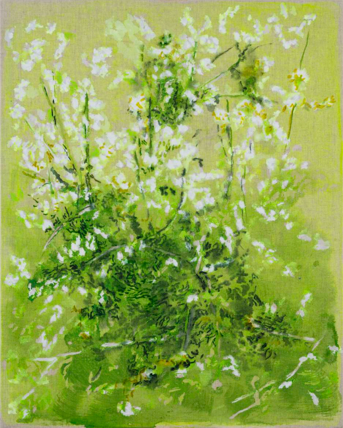
DIDIER BOUSSARIE Floraison de printemps I | 2025 acrylique sur toile / acrylic on canvas 81 x 65 cm / 31.89 x 25.59 in N° Inv. DB.2025.008