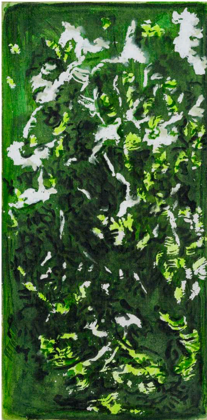
DIDIER BOUSSARIE Floraison de printemps III - B (triptyque) | 2025 acrylique sur toile / acrylic on canvas 60 x 30 cm / 23.62 x 11.81 in N° Inv. DB.2025.010