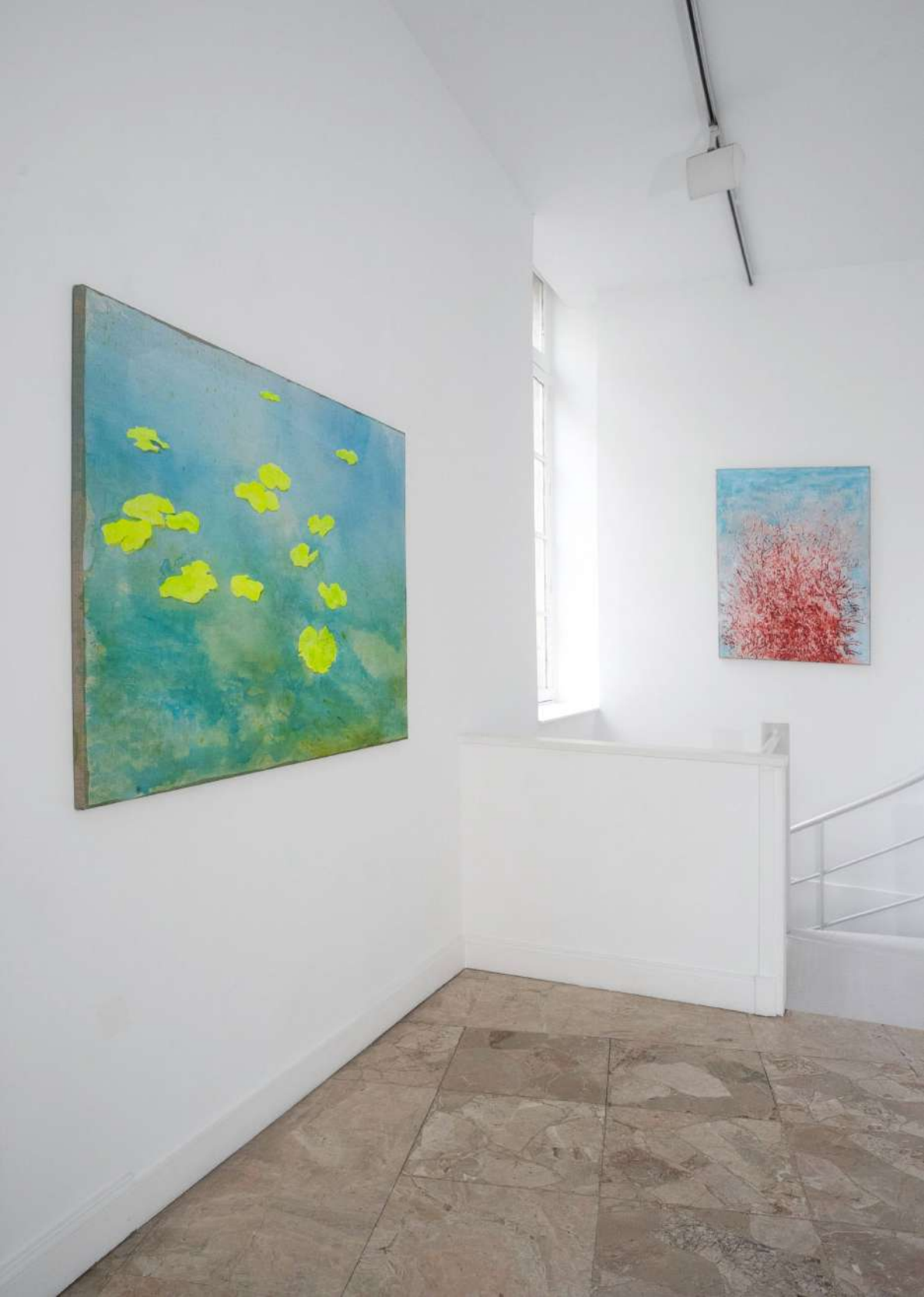
Didier Boussarie, Ce que la lumière touche – Galerie Maria Lund, Paris | 2026

Vue d'exposition / exhibition view